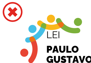
Não desalinhar os elementos