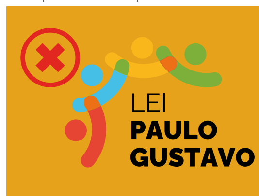
Exemplo de fundo proibido