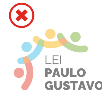
Não alterar a opacidade