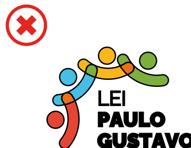
Não utilizar contornos