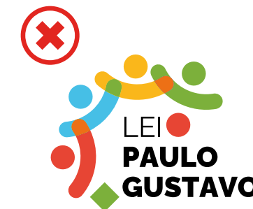
Não inserir elementos não previstos